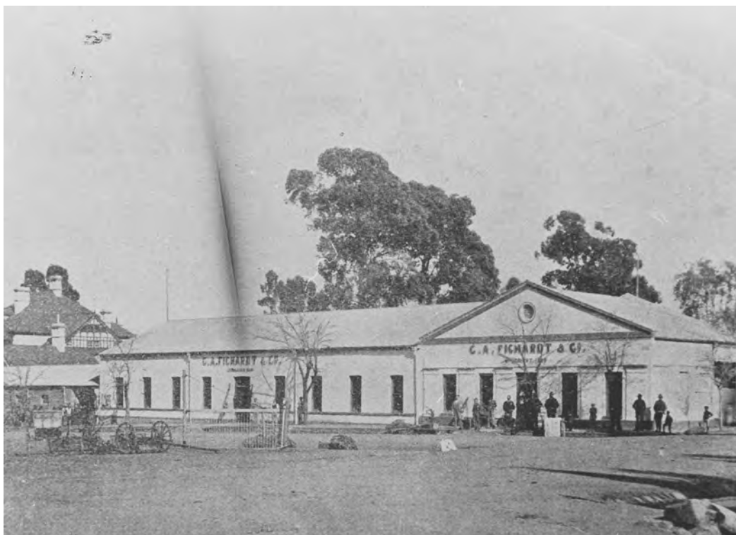
Figuur 4: Die Fichardt-winkel in die 1880's met die deftige Fichardt-woning, Kaya Lami, links sigbaar.