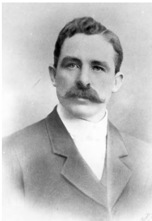
Figuur 7: Charlie Fichardt in 1898 as burgemeester van Bloemfontein.