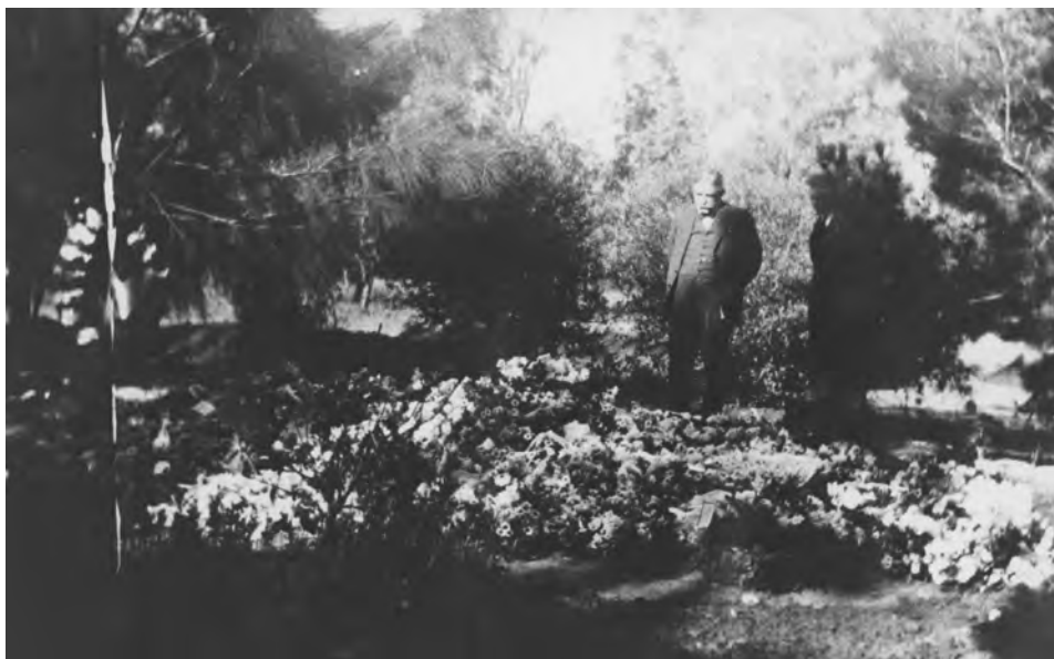
Figuur 10: 'n Bedroefde Charlie Fichardt in 1923 by sy dogter Valerie se graf op die familieplaas Brandkop net buite Bloemfontein.