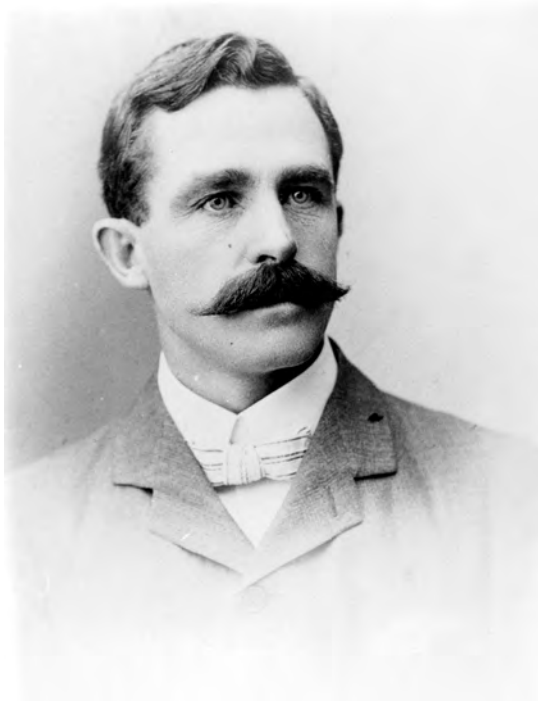
Figuur 1: Charlie Fichardt in 1902.